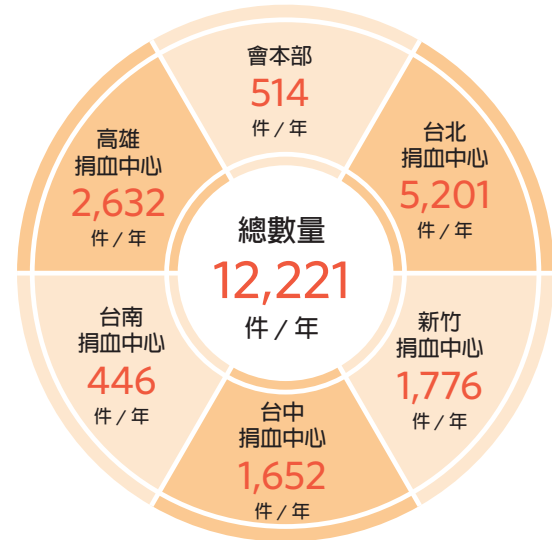
◆ 2021年系統請、採購案件統計