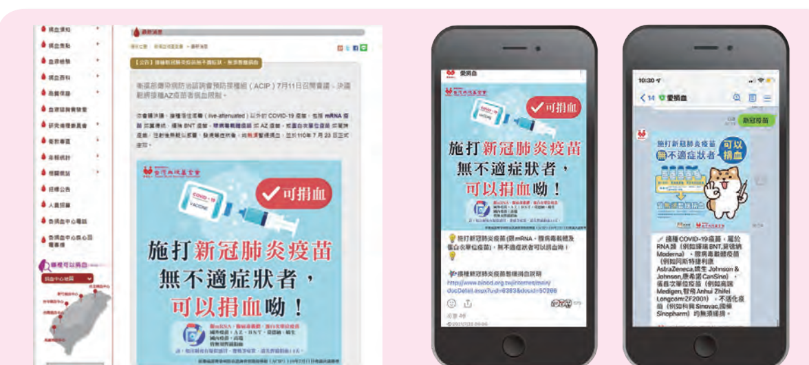
◆ 衛福部規定發布於官方網站、LINE VOOM 貼文、圖文推播、智能客服等多重管道，在疫情期間也能讓捐血人安心、用血人放心。

針對施打新冠疫苗暫緩捐血及疫情嚴峻民眾捐血意願降低之相關說明，本會官方網站依衛福部規定即時更新，並以《愛捐血》LINE 官方帳號、LINE VOOM 即時提供相關訊息。同時《愛捐血》LINE 官方帳號建置「智能客服關鍵字」，讓捐血人，24 小時都可查詢相關疑問。