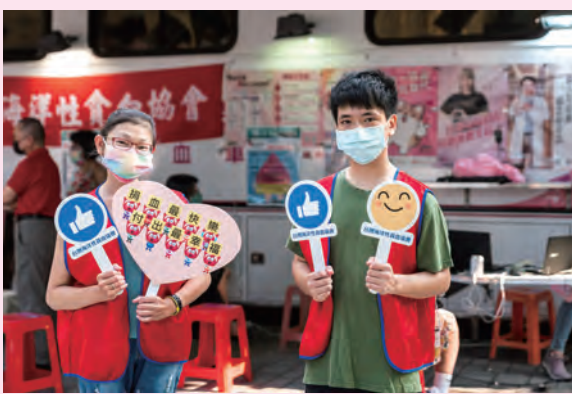
◆ 台灣海洋性貧血協會於台北市公園號捐血車舉辦捐血活動，病友熱情參與服務。