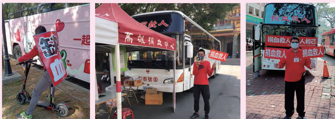
◆ 捐血中心同仁使出渾身解數各出奇招努力宣傳。左圖為捐血車駕駛背著海報騎滑板車用大聲公沿街宣傳；右二圖為捐血車駕駛協助在捐血車週邊廣播及舉牌宣傳。

在血源短缺的期間，需要定期輸血的海洋性貧血患者輸血間隔必須拉長，深感無血之苦，紛紛出來辦理捐血活動，傳達血液需求並感謝捐血人的無私付出。