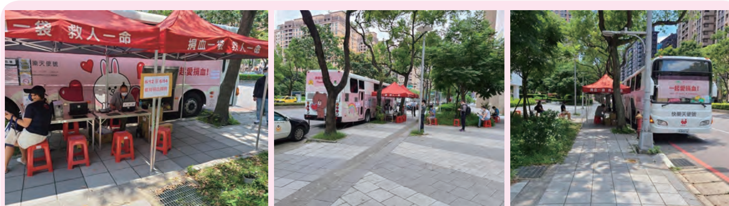
◆ 台北捐血中心積極於雙北尋覓可停放捐血車的地方，自行申請路權，自行動員於街區勸募血液、宣導捐血。

各捐血中心啟動緊急支援團體捐血，並積極於人車仍有流量處，停放捐血車，落實防疫措施，加強週邊宣傳，舉牌掃街，或宣傳車繞街，積極勸募捐血。