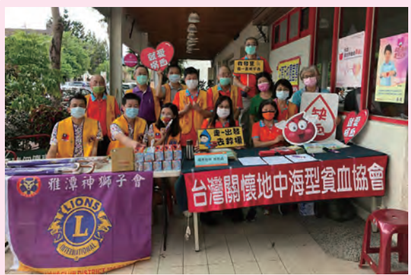
◆ 社團法人台灣關懷地中海型貧血協會於 2021 年 8 月 14 日假豐原捐血室與雅潭神獅子會共同辦理捐血活動，期望捐血人能持續捐血，幫助需血病人。

在血源短缺的期間，需要定期輸血的海洋性貧血患者輸血間隔必須拉長，深感無血之苦，紛紛出來辦理捐血活動，傳達血液需求並感謝捐血人的無私付出。