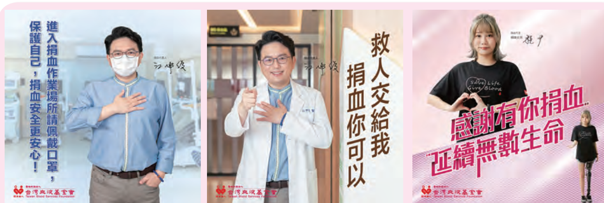
◆ 電視名主持人江坤俊醫師為我們拍攝宣導海報，讓我們針對不同群眾，以及不同主題，做更大廣度的宣傳。 ◆ 稅尹小姐，以受血人的身分來呼籲民眾捐血

江坤俊醫師不僅擔任捐血月代言人，更為我們針對不同群眾及不同主題拍攝宣導海報，加大宣傳廣度。稅尹小姐亦以受血人身分呼籲民眾捐血，展現說服力。