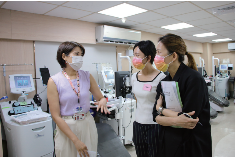
◆香港紅十字會輸血服務中心前來台北捐血中心南海捐血室參訪學習分離術捐血相關知識操作，包括預約、照護及宣導。