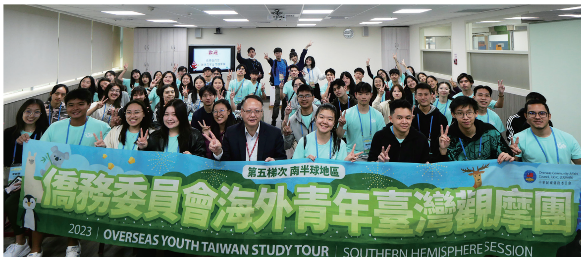
◆ 2023 年 12 月 5 日「海外青年臺灣觀摩團」105 人至台北捐血中心了解台灣國血國用的相關議題。

台北邑德扶輪社 2023 年 10 月 20 日捐贈「邑德 2 號」血液運送車，姐妹社日本富山未來社一同參與捐贈儀式及參訪台北捐血中心血液作業流程。日本扶輪社在捐血領域比較沒有相關的作為，故對台灣捐血事業與企業或社團合作表示很激勵，前社長長島谷治郎致辭時特別提到：「捐贈血液運送車是很棒的事情，傳遞著民眾的愛心，回到日本後我們也會討論是否能效仿類似的好事。」