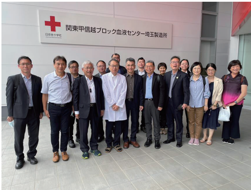
◆ 2023年7月5日於日本紅十字會關東甲信越血液中心埼玉製造所參訪。

為導入成分作業自動化，2023年7月3日至7日由執行長率業務處及各中心主任與血液製程相關人員，前往日本紅十字會總部、八重洲捐血室、關東甲信越血液中心埼玉製造所及東北廣域血液中心等參訪，除觀摩血液中心外，並針對成分製程自動化、自動倉儲揀料作業及血品庫存管理、血液檢驗、作業場域以輸送帶結合無人搬運車（Auto Guided Vehicle, AGV）運送血液等作業進行觀摩及交流。