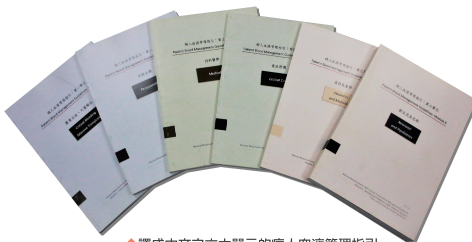
◆ 譯成中文之六大單元的病人血液管理指引

近年來，全球輸血醫學界戮力推廣「病人血液管理 (Patient Blood Management)」的觀念，病人血液管理是一項根據實證醫學，經由多專科團隊的探討，來保全並優化病人全身循環血量的病人管理方案，透過改善全身血量、減低失血、優化對貧血的生理耐受性等層面，來減少病人對輸血的需求，達到改善病人臨床結果的目的，此種血液管理方案目前已成為輸血醫學先進國家對病人照顧的主流策略。本會多年來致力於安全血液的供應，確保臨床用血無虞，同時亦以實證為基礎，進一步保障輸血病人的安全。由澳洲國家血液管理局出版之「病人血液管理指引」，內含六大單元：「嚴重出血大量輸血」、「手術全期」、「內科醫學」、「重症照護」、「產科及產婦」、及「新生兒及兒科」，為當今可取得最為完整之參考資料。為在台推廣，徵得出版方同意後，特譯成中文，內容經國內各該領域之專家再審查，編印成冊分送用血量排名前50名之醫院，期望能幫助臨床醫師衡量輸血療法與其他替代方案對改善病人結果之好處與風險，來合理輸注血液成分，提供病人更為適當之照護方案。希能藉此拋磚引玉，推廣病人血液管理之觀念。