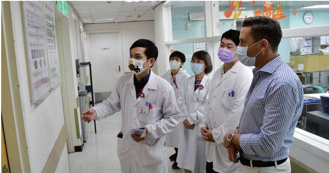
◆ 立陶宛國家血液中心主任 Daumantas Gutauskas 參訪台北捐血中心。

韓國首爾醫檢師公會 2023 年 8 月 4 日由理事長 Bok-Man Kang 率理監事一行 12 人至台北捐血中心觀摩。先以簡介影片讓大家認識台灣捐血運動的歷史與文化，並對作業流程有初步的了解；接著安排實地參訪作業流程，包括捐血流程、血品成分分離、血液檢驗、血品供應及儲存等。參訪結束後，在合影時喊出「台灣，好棒！」透過彼此經驗的分享及吸收新思維，瞭解其他國家血液機構的創新措施，讓國際交流也成為一次成功的國民外交。