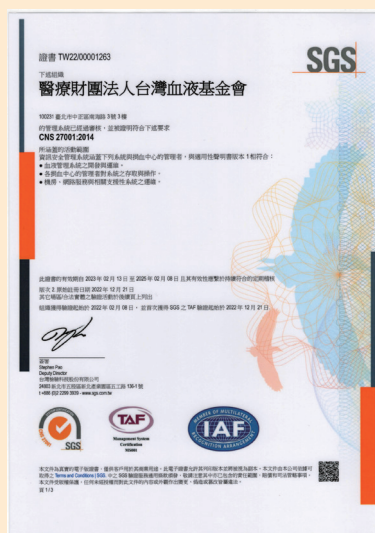
CNS27001 : 2014 證書