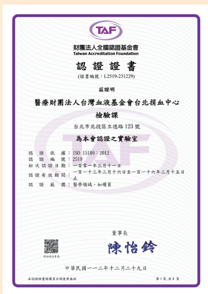
TAF ISO15189 證書 - 台北