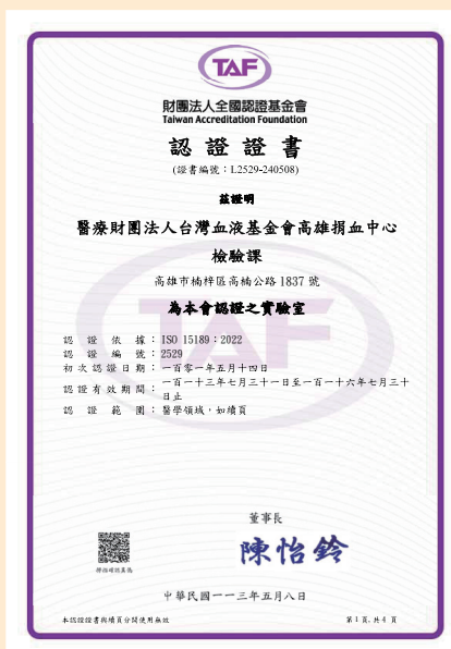
TAF ISO15189 證書 - 高雄