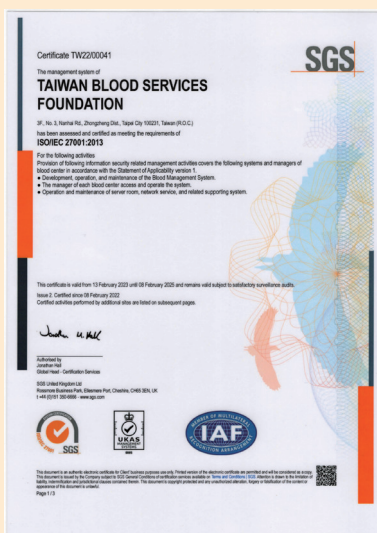
ISO27001 : 2013 證書